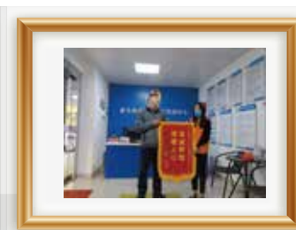
社区康复人员感谢彩虹社工 对其帮扶