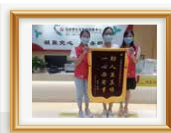
居民致谢机构社区服务