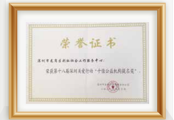
荣获第十八届深圳关爱行动十佳公益机构提名奖