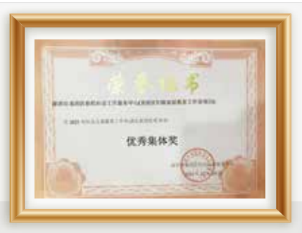
龙岗区妇联家庭教育工作室 荣获2021年优秀集体奖