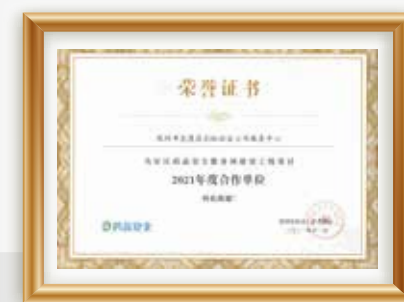
“社区药品安全服务网建设工程项目”2021年度合作单位