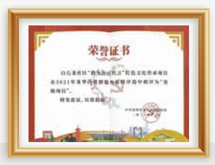
我为社区代言红色文化传承项目-荣获 2021年龙华区党群服务星级项目