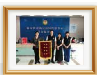
居民感谢机构社工