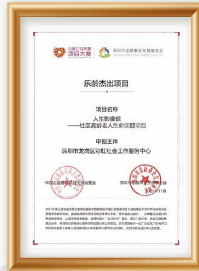
人生影像馆项目——中国慈善公益项目大赛养老服务赛道乐龄杰出项目奖