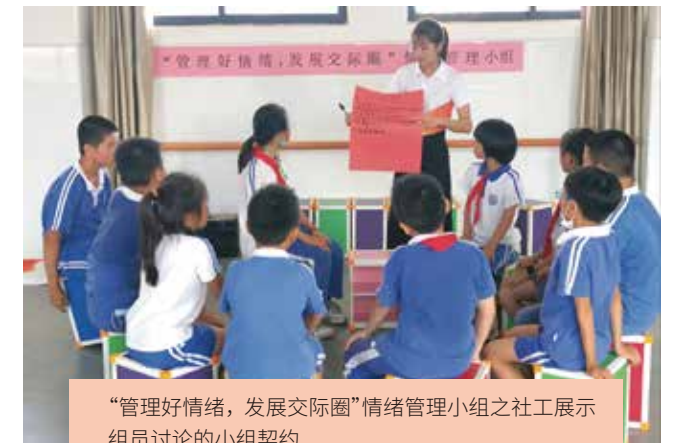
“管理好情绪, 发展交际圈”情绪管理小组之社工展示组员讨论的小组契约

社工通过家长、老师、学生访谈, 社区、家庭走访, 校内观察, 问卷调查、量表测试等方式, 采用专业化工具获取多元化信息, 逐步精准服务需求, 重点关注校园适应、注意力缺失、情绪调节、朋辈冲突等问题。通过在 20 余所学校提供危机干预及个案服务, 93% 以上的学生接受服务后能够顺利度过危机或提升解决问题的能力。