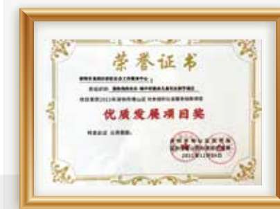
“我和我的社区-城中村流动儿童社区研学项目”荣获“优质发展项目奖”