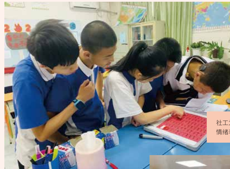
社工为听障学生开展自我认知主题活动，学生在认识情绪表

深圳市困境儿童关爱保护“政策宣讲进社区”项目从困境儿童监护主体、儿童自身、儿童主任等多个面向，为全市范围内的儿童群体及其家庭展开针对性的社区教育服务，精准帮扶广大儿童尤其是困境儿童健康快乐成长。重点打造了市、区未保中心和街道未保工作站三级未保工作阵地，同时也组建了“儿童督导员+儿童主任+儿童福利社工”的多元服务主体的基层儿童工作队伍，主要集中在家庭、学校、社区三大服务场所开展困境儿童的关爱和服务工作，通过这种“三级服务阵地+三类服务主体+三大服务场所”的“三三制”模式，将服务阵地、服务主体和服务切入点有效协调起来，不仅加大了基层儿童关爱服务体系支持建设力度，也提升了儿童福利服务水平并有效整合层级资源，为全面建立未成年人救助保护机制发挥了引领作用，形成了独具特色的民政履职困境儿童关爱保护工作的深圳样本。该项目获得深圳市救助管理站(市未成年人救助保护中心)25万余元资助。该项目在广东民政、深圳民政、深圳侨报、深圳晶报、深圳特区报等多家媒体报道。