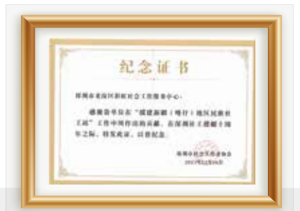
援建新疆(喀什)纪念