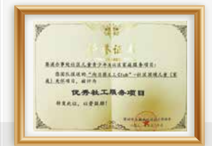
《向日葵义工Club-社区困境儿童(家庭)关怀项目》—优秀社工服务项目