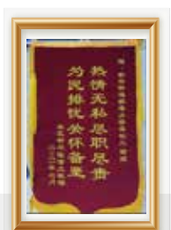
居民感谢彩虹社区社工服务