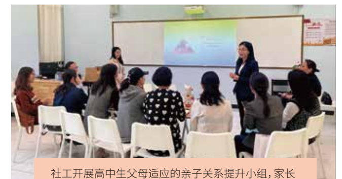
社工开展高中生父母适应的亲子关系提升小组, 家长分享亲子关系维护的经验做法

社工通过引导家长参与学校事务、学习家庭教育等方式, 使家长们能够与学校形成良好的家校共育关系, 并掌握科学的家庭教育技巧, 增加亲子沟通、增进亲子感情; 通过教师减压与拓展服务, 促进教师间的交流学习, 减轻教师教学压力, 舒缓其负面情绪, 为学生提供了良好的学习生活环境。