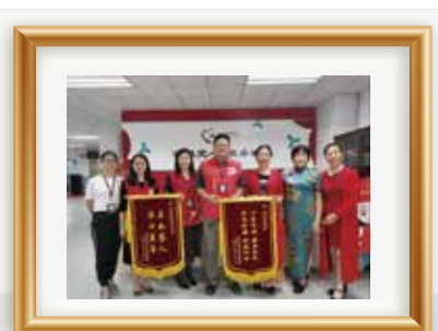
服务对象致谢机构社区服务