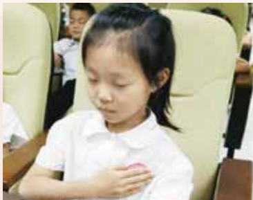
社工开展“感受生命，润心成长”生命教育小课堂中，学生感受自己心跳

社工通过走访调研、学生心理体检报告撰写，了解在校学生的心理状态，排除学生的心理隐患；通过开展生命教育剧场及抗逆力服务项目，增加了学生对生命教育的理解及抗挫能力，预防和减少了生命事件的发生；通过编制和发放《生命教育手册》，扩大了生命教育的影响范围，有效地维护了校园的稳定与和谐；2021年，成功介入了20余起危机个案，化解了10余名学生的自杀倾向，成功介入2起家暴危机事件，有效干预1起遭遇性骚扰的学生个案，案主的危机均得以解除，避免了生命的丧失。