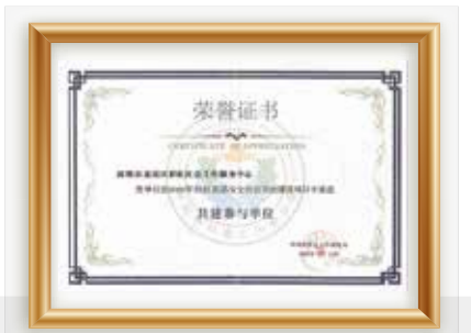
2020年食品药品共建单位