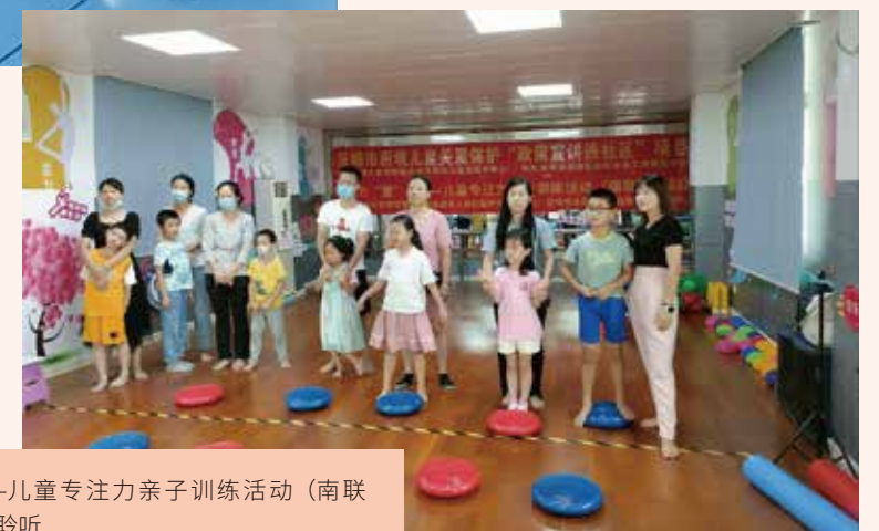
“童”伴专注力—儿童专注力亲子训练活动(南联场)—亲子认真聆听