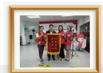
合作伙伴感谢机构社区服务